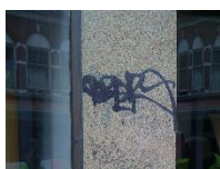
B Inkt/stift (tag) op natuursteen.