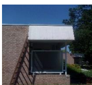
A Atmosferisch vuil en roet op volkern..

Onze adviseur synchroniseert het geschikte product in een Technisch Advies naar uw (specifieker) gebruik of project/aanbestedingsonderdeel.